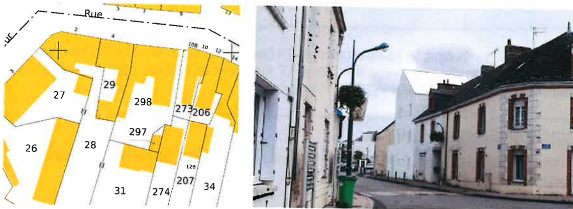
Plan Cadastral et intégration du projet dans son environnement

Silène est chargé d'une opération de construction de 5 logements collectifs pour une surface plancher de 286 m 2 , 6-8 rue Jean Jaurès à Montoir de Bretagne. Le projet s'intègre sur une parcelle située en cœur de bourg, sur l'artère principale commerçante, concernée par des travaux dans le cadre du projet de développement des lignes de bus Hélyce (2025).